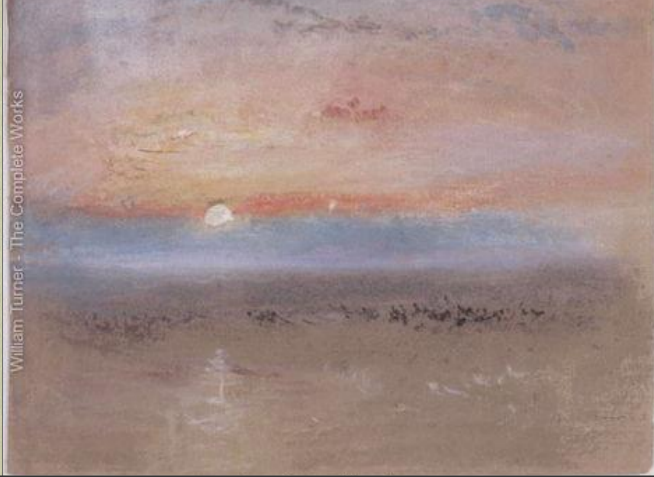
William Turner - The Complete Works